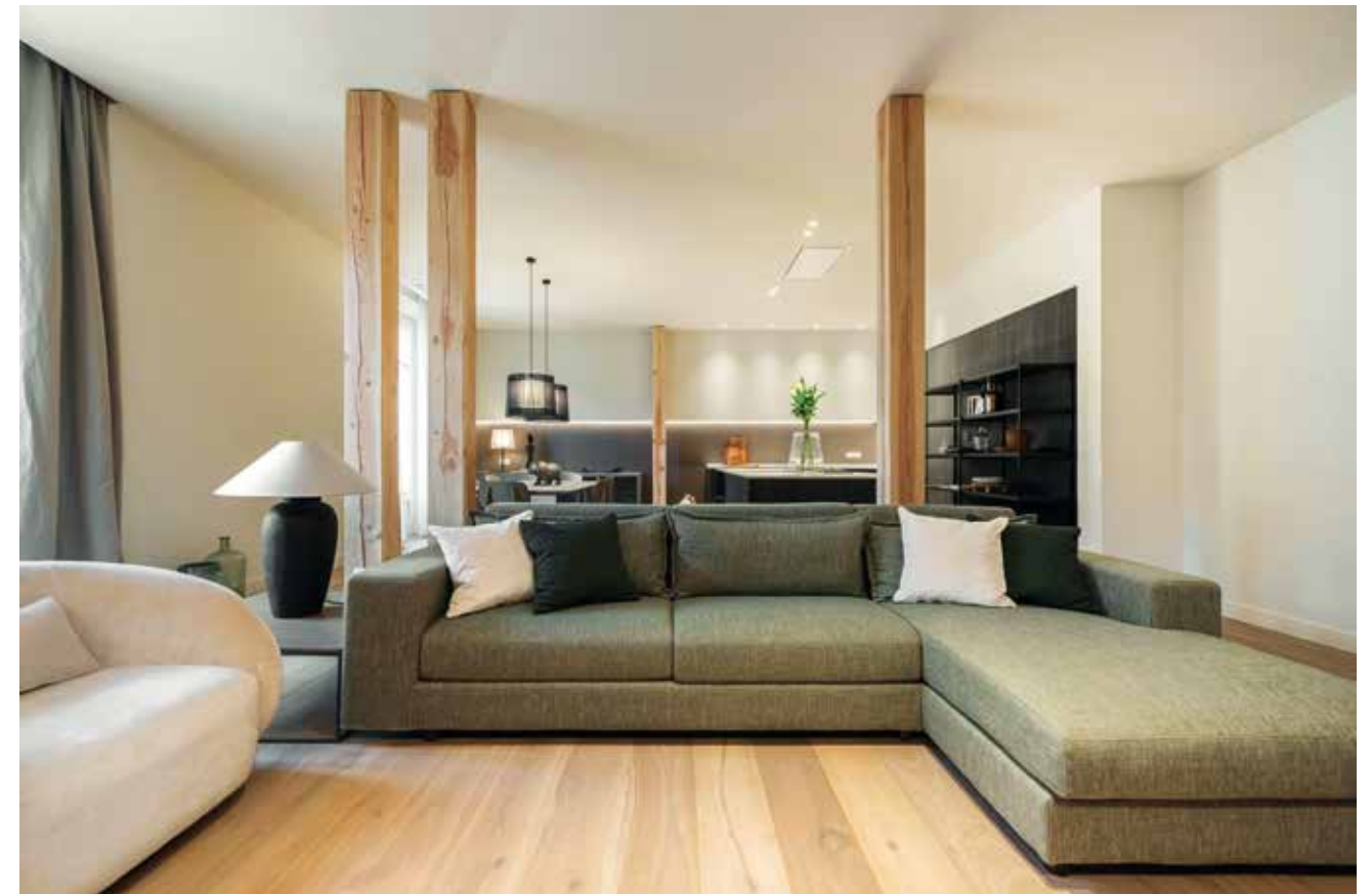
TEXTOS: PAU MONFORT.